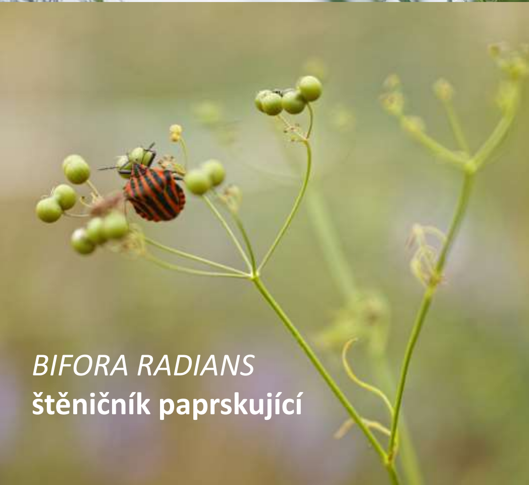
BIFORA RADIANS štěničník paprskující